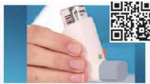
Dosier-Aerosol mit Zählwerk