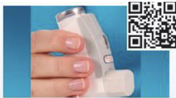
Dosier-Aerosol mit Zählwerk und Ampelfunktion